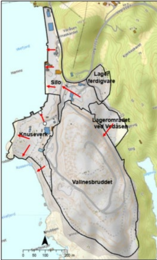
Figur 4: Oversikt over nedbørsfelt på Rekefjord øst generert i Scalgo live. Avrenningsveier er markert med røde piler