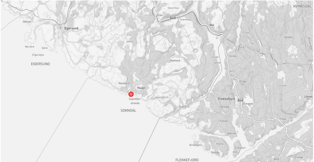
Figur 1: Tiltakets plassering i region.

Steinbruddet består i dag av to brudd, ett på østsiden og ett på vestsiden av fjorden. Dette initiativet gjelder bare en endring av eksisterende driftsdybde i Vallnesbruddet, på østsiden av Rekefjorden. Rekefjord Øst utviner knust stein i form av blokk, pukk og grus av bergtypen Noritt, og anvendes hovedsakelig som tilslagsmateriale til betong og asfalt. Den grovere massen brukes blant annet til havvindprosjekter, kystsikring, moloer og dekking av kabler i Nordsjøen.