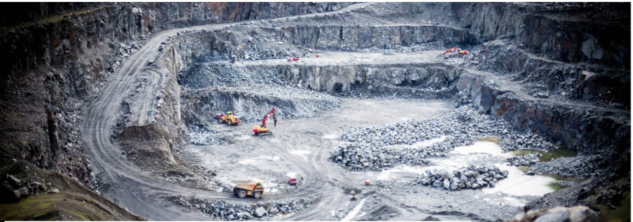
Bilde 1: Bunn av eksisterende steinbrudd i Vallnes.

Dagens bunn av Vallnesbruddet kan ses i foto under. Det viser også den avtrapping i pallhøyder på ca. 12 meter som finnes i dag. Endringen som foreslås er kun å gå to pallhøyder dypere i bunnen av bruddet.