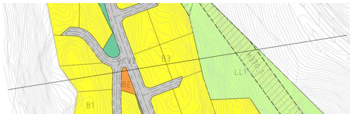
Plassering av tverrsnitt