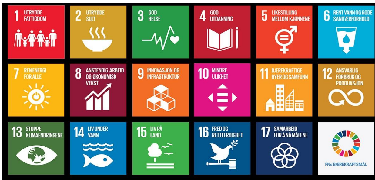
Figur 2 FNs bærekrafts mål, www.fn.no

En bærekraftig samfunnsutvikling er en utvikling som imøtekommer dagens behov uten å ødelegge mulighetene for at kommende generasjoner skal få dekket sine behov. For å ivareta en bærekraftig utvikling må det i planarbeidet tas hensyn til alle tre bærekraftsområdene; klima og miljø, økonomi og sosiale forhold.