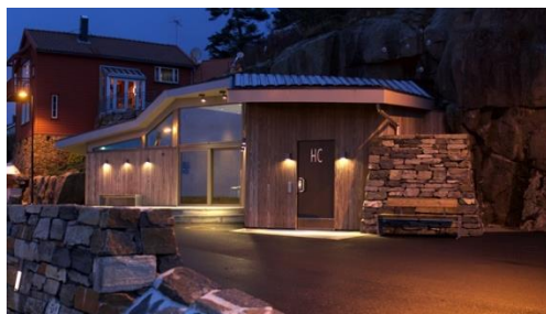
Servicebygg Sogndalstrand.