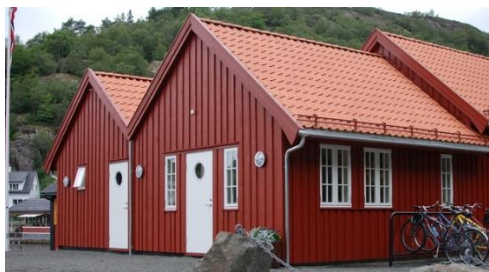
Servicebygg, Malmkaien.

Sokndal kommune har gjestekaier ved Malmkaien og Sogndalstrand hvor det er oppført servicebygg med dusj- og toalettfasiliteter samt vaskemaskin.